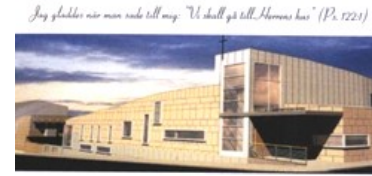
St Pauli Katolska Församling Gävle

”Stanna hos oss. Det börjar bli kväll, och dagen är snart slut.” Då följde han med in och stannade hos dem. När han sedan låg till bords med dem, tog han brödet, läste tackbönen, bröt det och gav åt dem. Då öppnades deras ögon, och de kände igen honom, men han försvann ur deras åsyn. Och de sade till varandra: ”Brann inte våra hjärtan när han talade till oss på vägen och utlade skrifterna för oss?” De bröt genast upp och återvände till Jerusalem, där de fann de elva och alla de andra församlade, och dessa sade: ”Herren har verkligen blivit uppväckt och han har visat sig för Simon.” Själva berättade de då vad som hade hänt dem på vägen och hur han hade gett sig till känna för dem genom att bryta brödet.